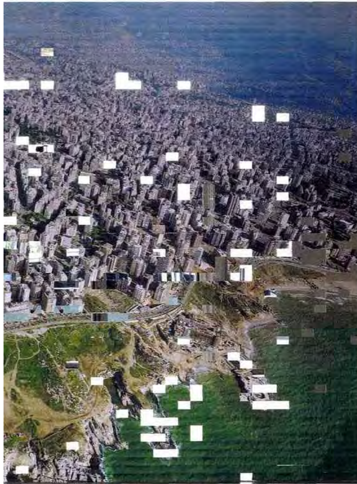
Le Centre de confusion, 1997, Joana Hadjithomas &amp; Khalil Joreige, Bèzele in Situ, Editions Leletac